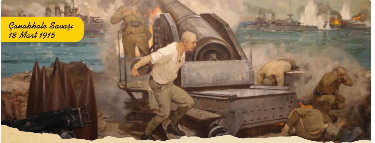
Çanakkale Savaşı 18 Mart 1915

Türk askerinin kahramanca mücadelesine sahne olan Çanakkale Savaşlarında 250.000 civarında Türk askeri şehit oldu. Bu ölen gençlerin çoğu yükseköğretim gören gençlerdi.