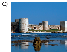
Mersin Kız Kalesi