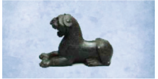
Bronz Aslan Heykeli

Yukarıda Van ilinde yer alan ve turizm açısından değer taşıyan bazı örnekler verilmiştir. Bu örneklerden hareketle, Van ile ilgili;