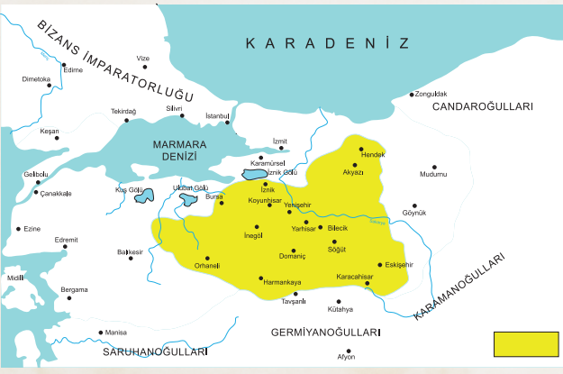
Osman Bey Dönemi'nde fethedilen topraklar

Osmanlılar ele geçirdikleri yerlerdeki gayrimüslim halka son derece iyi davrandılar; yağma yerine onları himaye altına alıp vergiye bağlamayı tercih ettiler.